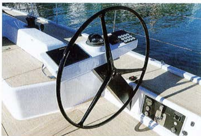
Poste de barre. A noter la colonne en carbone, spécificité de la version RS ainsi que le pont en teck synthétique très réussi.

winches Antal allégés...). Le gain est de 1,6 tonne. La surface de voilure déjà généreuse (157 mètres carrés au près et un grand spi de 300 mètres carrés) n'a pas été augmentée. Sous voiles, le comportement de ce RS est remarquable. Vif, parfaitement équilibré, c'est un vrai plaisir de jouer au près dans la houle en plaçant l'étrave au petit poil. Les deux belles barres à roue sont parfaitement déportées et une console devant chacune permet d'avoir les instruments