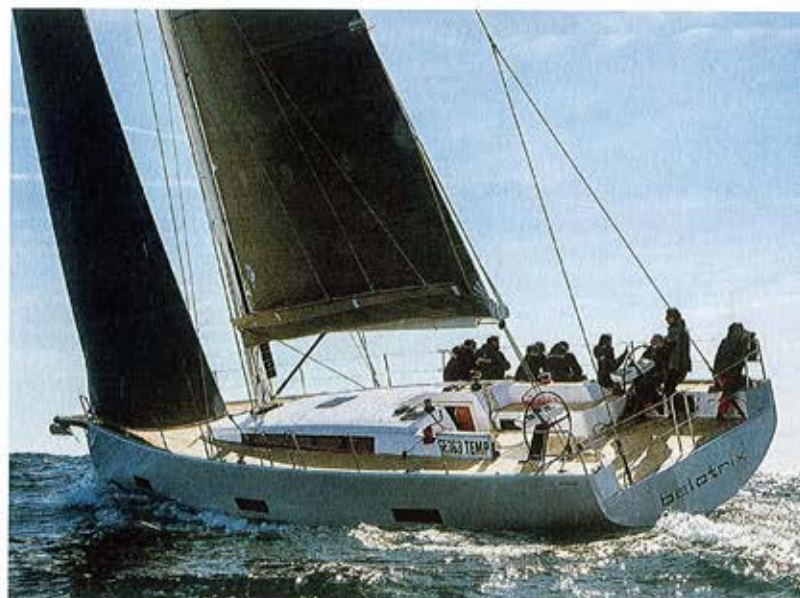
Carène. Comme tous les Ice, le 52 est signé Umberto Felci, architecte qui fait rimer élégance et vélocité.