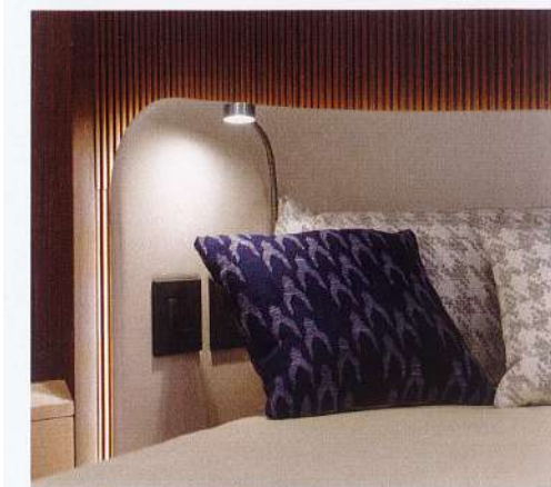
Das Design ist elegant und stimmig