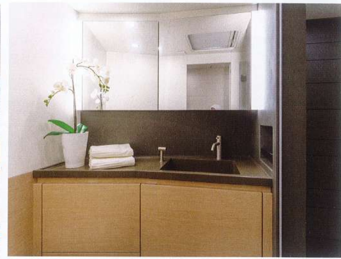
Vorbildliche Spaltenmaße erfreuen das Auge

Wer kocht, hat die Familie im Blick und bleibt im Gespräch. Die Kücheninsel erlaubt die Zubereitung von Speisen an einem krängungsarmen Ort