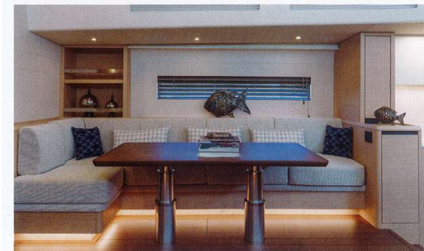
Der Tisch kann elektrisch abgesenkt werden